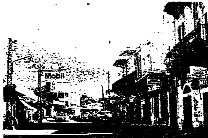
الشارع الرئيسي .. حركة خفيفة